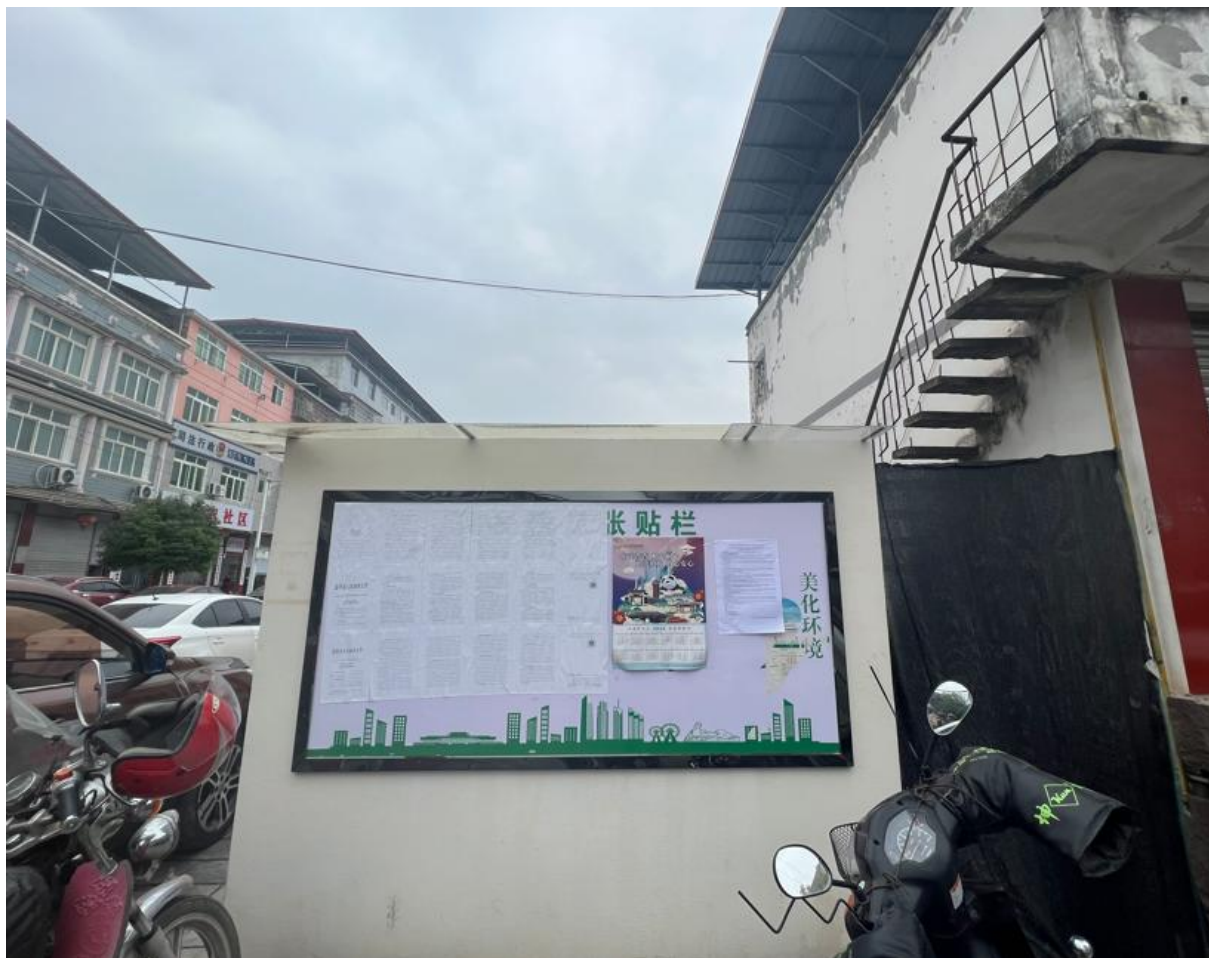
图9 本项目张贴公示

我单位于2023年12月15日至2022年12月20日在广元市昭化镇人民政府外公告栏张贴了公告信息。