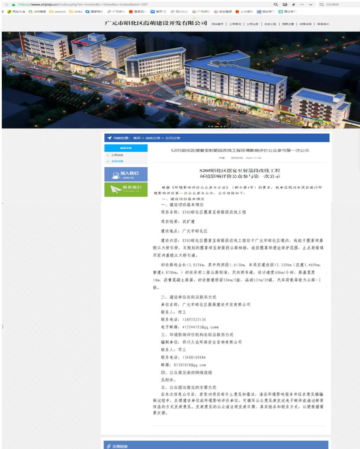
图1 本项目环境影响评价公众参与第一次公示